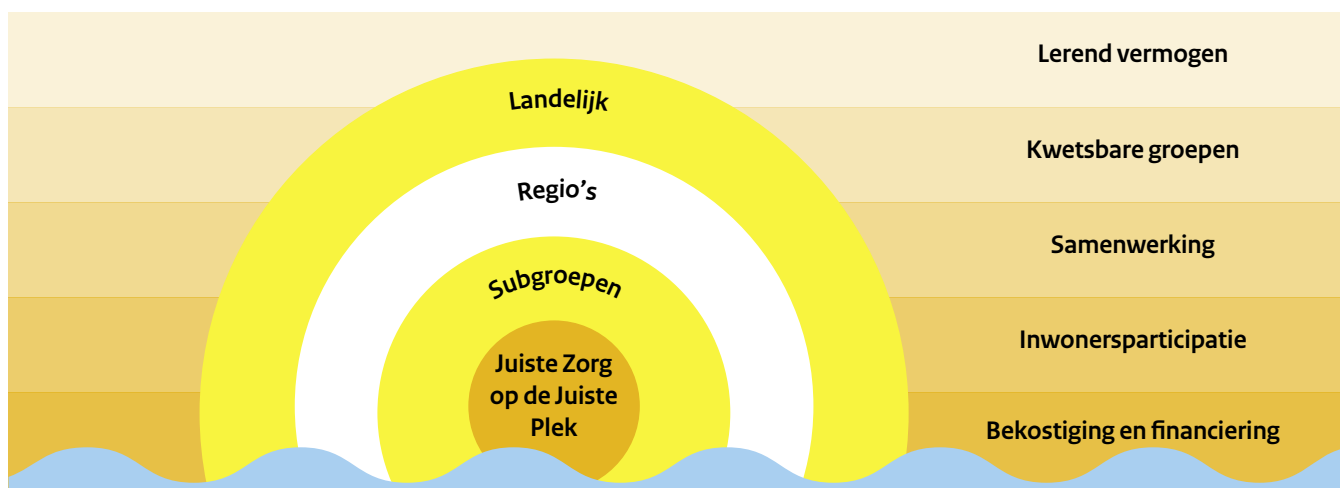
Figuur 2. Inhoudelijke focus lerende evaluatie JZOJP

De deelnemers aan de actietafels willen graag aan de slag met de door hen benoemde ontwikkelvragen . Dit zal in 2021 gebeuren tijdens de actietafels alsook tijdens verdiepende case-studies met de deelnemers aan de actietafels. Zo wordt met de actietafel van de leerregio's gestart met een bijeenkomst in het voorjaar gericht op een domeinoverstijgende verbetercyclus, een tool om als regio de versnellingskansen in de samenwerking te achterhalen, en een businesscase vanuit sociaal en medisch domein. Verder zoomen we in 2021 op drie specifieke subgroepen in: ouderen, mensen met mentale diversiteit en veelgebruikers. Deze activiteiten worden afgestemd en verbonden met andere programma's en initiatieven, zoals de GROZzerdammen (Health Holland, 2020) en het kennisplatform JZOJP. Tevens zullen we met de actietafels en de landelijke tafel aan de slag gaan met de centrale hoofdvraag: 'wat is nodig om de beweging JZOJP verder te brengen?'. Wat is nodig om de beweging JZOJP verder te brengen?